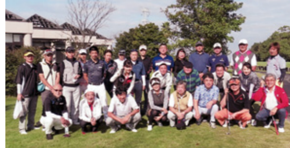
〔第52回喜梅会〕 ①H27年10月18日 ② ③32名 ④さみさらずゴルフリンクス ⑤