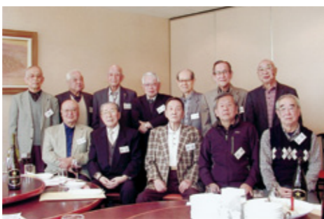
〔日大四中第16期同期会〕 ①H28年4月15日 ②③12名 ④横浜東口「大陸」スカイビル 11階 ⑤