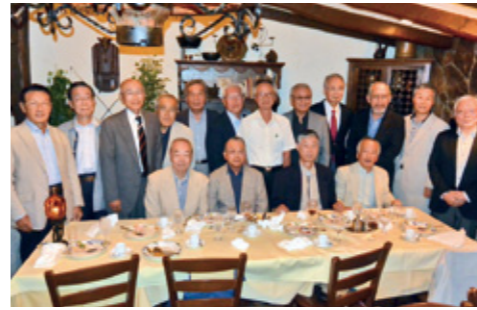
〔日大高校11期F組クラス会〕 ①H27年9月30日 ② ③17名 ④カサ・デ・フジモリ関内店 ⑤

E-mail: dosokai@yokohama.hs.nihon-u.ac.jp