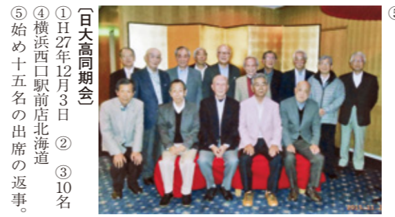
〔日大高同期会〕 ①H27年12月3日 ② ③10名 ④横浜西口駅前店北海道 ⑤始め十五名の出席の返事。