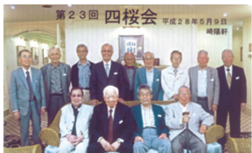
〔四桜会〕 ①H28年5月9日 ②③14名 ④崎陽軒3階 ⑤