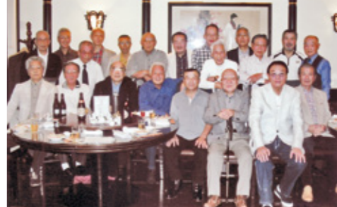
〔商業12期C組クラス会〕 ①H27年10月17日 ② ③20名 ④横浜中華街元樓本店 ⑤