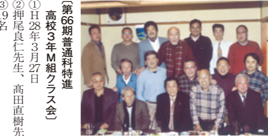
〔櫻美会〕 ①②③17名 ④日ノ出町「二会」