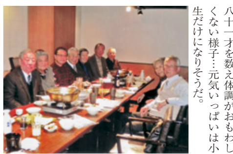
十一月末日までに欠席の連絡又当日ドタキャン志名。最後十名のクラス会になりました。皆八十一才を数え体調がおもわしくない様子。元気いっぱいはい小生だけになりそうです。