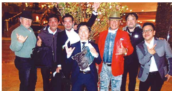
〔普通科17期A組クラス会〕 ①H28年4月16日 ②なし ③23名 ④横浜中華街「龍仙」 ⑤