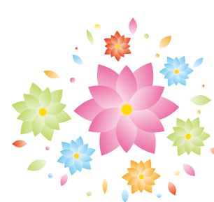
〔柔道部O.B.会〕 ①H28年1月15日 ②峯岸義則先生、高橋良治先生、金子伸一先生 ③56名 ④新横浜グレイスホテル ⑤12時より柔道の練習が行なわれ、15名のO.B.が練習をし、汗を流し、17時より場所を、新横浜のグレイスホテルに場所を移し、O.B.会が行なわれ、今年度卒業する4人の部員も招待され、楽しく行なわれた。