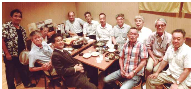
〔懇親会〕 ①H28年9月11日 ② ③12名 ④居酒屋すつとこい ⑤