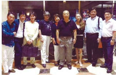
〔H3H佐藤組クラス会〕 ①H28年12月8日 ② ③13名 ④「幸楽」横浜駅東口中華 ⑤・年一回定例クラス会 ・各人の近況報告他